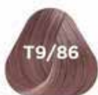
T9/86 MILK CHOCOLATE tejsokoládé