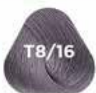
T8/16 STEEL acél