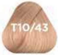
T10/43 APRICOT sárgabarack