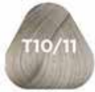
T10/11 ASH hamvas