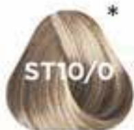
ST10/0 PLATINUM BLONDE platina szőke