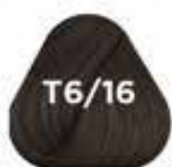
T6/16 GRAPHITE grafit