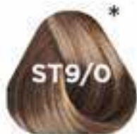
ST9/0 VERY LIGHT BLONDE nagyon világos szőke