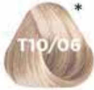
T10/06 SAND homok