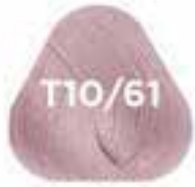
T10/61 ICE IRISÉE