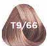
T9/66 BISCUIT keksz