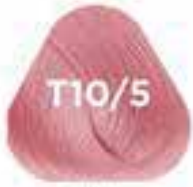
T10/5 PINK rózsaszín