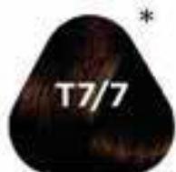
T7/7 CHESTNUT gesztenye